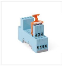
S9M (EL4378679) Skrusokkel QRC til C9-releer 14-stift